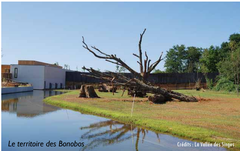
Le territoire des Bonobos

Il a une superficie de près de 900 m 2 , sur deux niveaux. Le premier niveau abrite, d'une part, une douzaine de cages de service de 20 à 30 m 2 de surface et de 3,75 m de haut, et modulables, conçues pour la gestion du groupe social des singes (isolement ou séparation temporaire...) , et de l'autre, deux grandes cages de 100 m 2 de 6,25 m de haut, visibles du public. Le deuxième étage de 350 m 2 , accessible par une passerelle extérieure, représente l'espace public où les visiteurs disposent d'une salle d'accueil de 160 m 2 et d'une salle de projection attenante de 60 m 2 . Ils pourront assister à la projection d'un reportage qui leur fera découvrir un projet de protection et de conservation de bonobos mené par une ONG congolaise, Mbou-Mon-Tour , dont la Vallée des Singes soutient les activités.