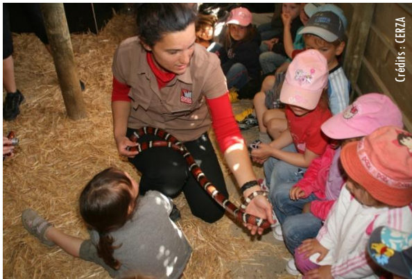
Toucher de l'animal