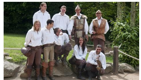
L'équipe de fauconniers du Puy du Fou