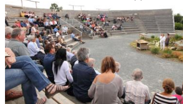
Discours pour les 30 ans