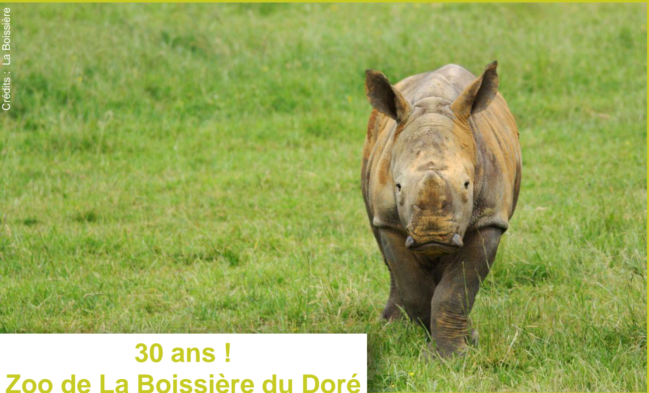
Mapenzi, Rhinocéros blanc