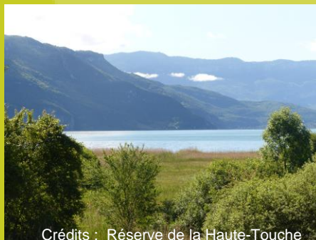
Lac du Bourget

Muséum national d'Histoire naturelle : Cécile BRISSAUD : 01.40.79.80.75 / brissaud@mnhn.fr