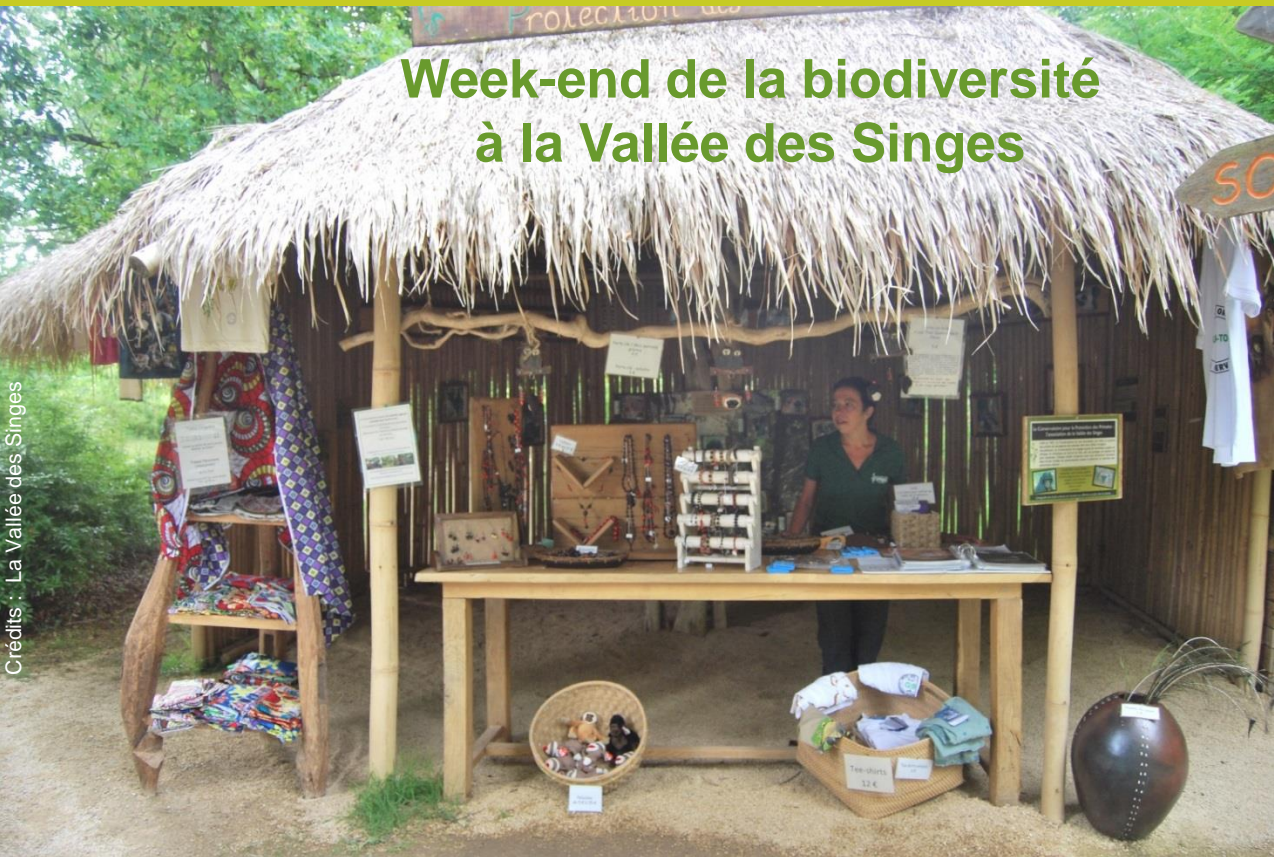
Stand du Conservatoire pour la Protection des Primates

Pour le week-end du 14 juillet (les 12, 13, 14 et 15 juillet), le Conservatoire pour la Protection des Primates (association de la Vallée des Singes) a organisé un week-end événementiel autour du thème de la Biodiversité.