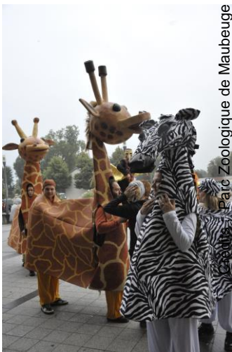
Parc Zoologique de Maubeuge

un petit cadeau était offert aux familles ayant fait leurs courses sans huile de palme ! Et celles qui n'avaient pas réussi avaient bien entendu le droit de recommencer avec l'aide d'un volontaire.