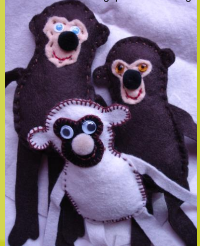
Gibbons en feutrine Journée Kalaweit